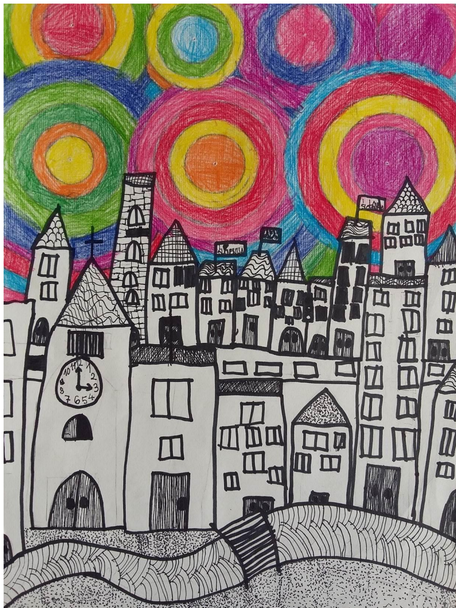
Osnovna šola Gabrovka – Dole